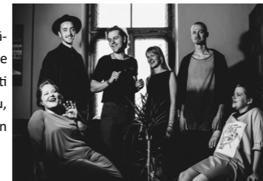
Grupa „The Coco'nuts”